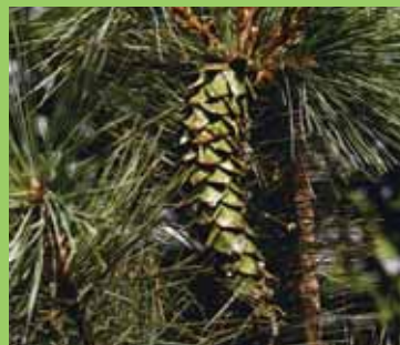
Šišky borovice mexické, P. ayacahuite