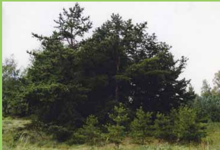
Borovice pichlavá, P. pungens