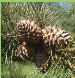
P. pungens , šišky