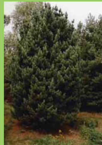
Borovice limba, P. cembra , výsadba z r. 1958