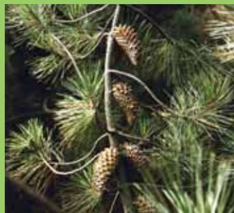
Šišky borovice oslabené, P. attenuata