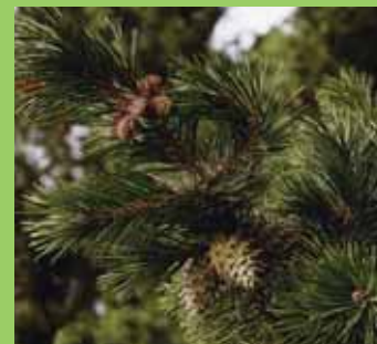
Šišky borovice pichlavé, P. pungens