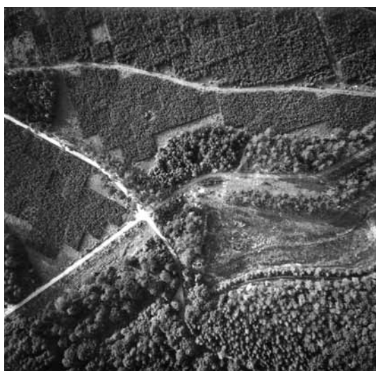
Arboretum okolo vypuštěného rybníka, o okolí patrně provenienční výsadby borovic ve čtvercích 13 x 15 m