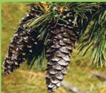
Šišky borovice vejmutokovité, P. strobiformis