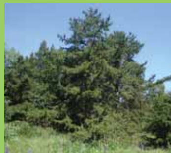
P. pungens , habitus