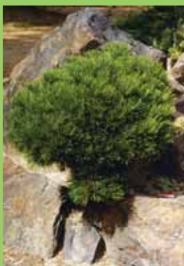
Borovice „Šmidtka“, P. heldreichii var. leucodermis 'Šmidt'