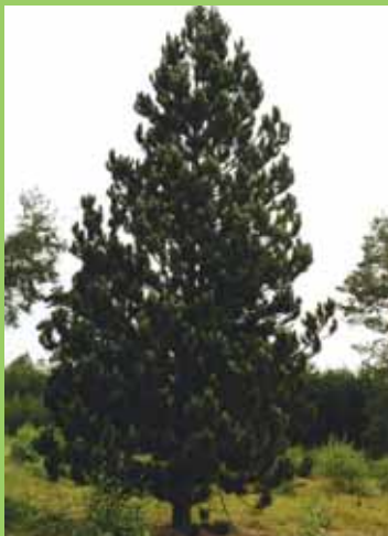
Borovice Heldreichova, P. heldreichii , 40 let