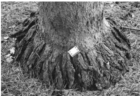
Podnož a roub – nejstarší roubovaná borovice lesní (z r. 1952)