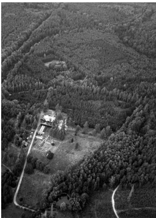
Letecký snímek arboreta v současnosti, zachycen vstupní areál se služební budovou VÚLHM