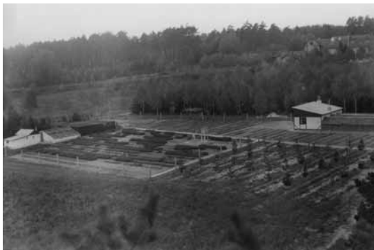
Arboretum v roce 1962

dily správnost cesty, kterou se naše pracoviště ubírá. Protože pouze v souladu s přírodními zákonitostmi můžeme ve výzkumu lesních dřevin dosáhnout výsledků, které budou mít význam nejen pro nás, ale i pro budoucí pokolení.